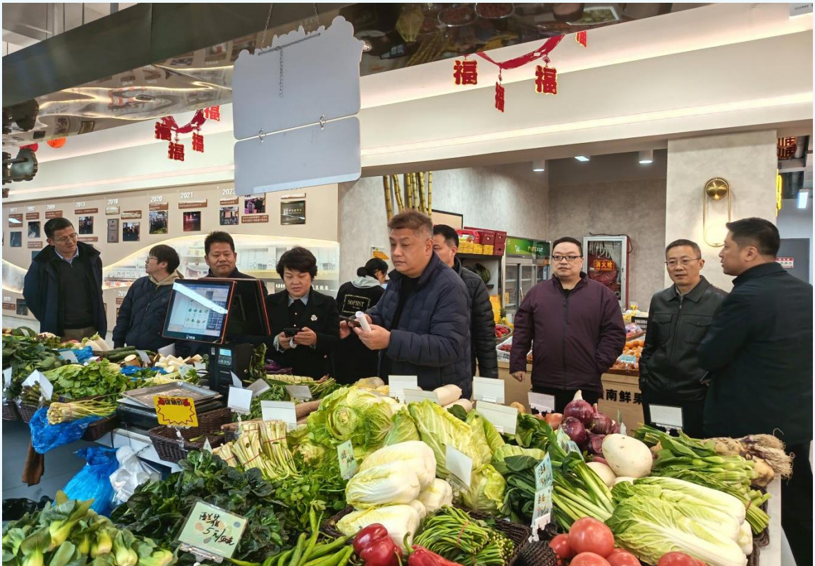
上海市武定菜市场

为深入学习借鉴国内先进省市专业市场与菜市场成功经验，破解本地市场发展瓶颈，推动我市市场高质量发展，3月16日至20日，我会秘书长陪同市商务委领导一行，分别赴上海市、浙江省杭州市、义乌市及汉口北市场集群，开展实地考察调研，深入走访13个典型市场，并与有关省市商务主管部门、行业协会、市场运营主体及商家代表进行了座谈交流。