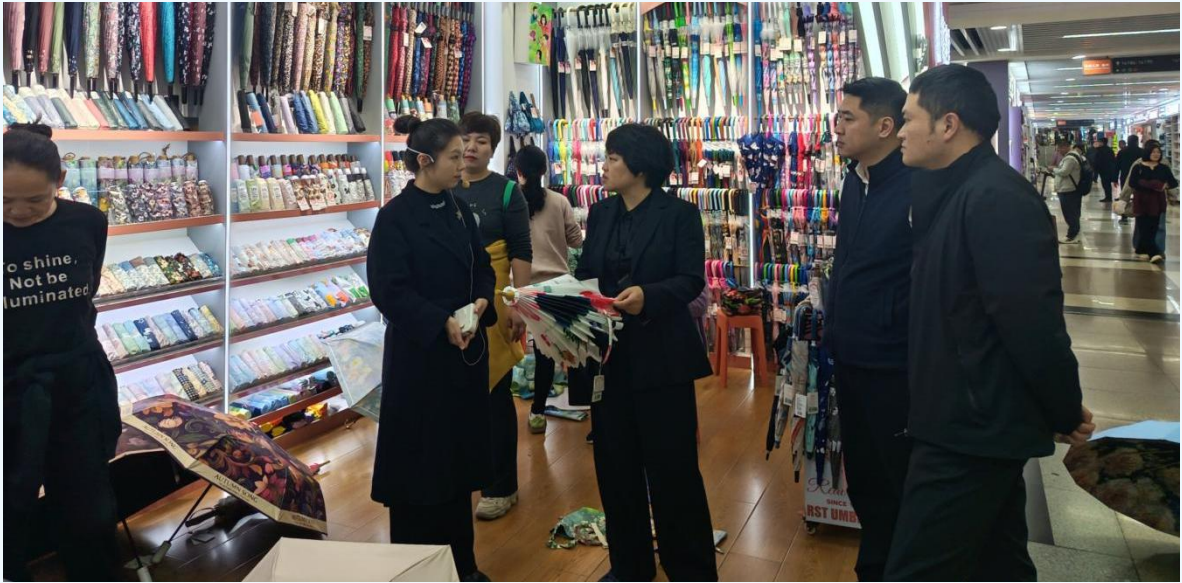
浙江省义乌国际商贸中心

走进浙江省义乌国际商贸城、全球数贸中心、义乌国际家居城、稠关菜市场，实地察看了市场标准化规划运营、AI 营销推广、跨境电商运营、智能巡检等情况，详细了解义乌市从马路市场到第六代市场建设培育以及数字化赋能、供应链完善、商户服务保障等方面的创新举措，推动“人、货、场、链”数字化升级，实现从坐商、行商到“云商”的转型经验。