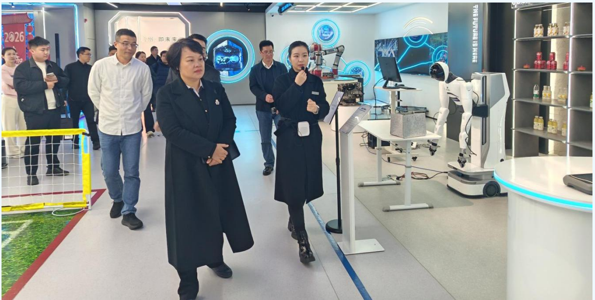
浙江省杭州文三数字生活街区

走进浙江省义乌国际商贸城、全球数贸中心、义乌国际家居城、稠关菜市场，实地察看了市场标准化规划运营、AI 营销推广、跨境电商运营、智能巡检等情况，详细了解义乌市从马路市场到第六代市场建设培育以及数字化赋能、供应链完善、商户服务保障等方面的创新举措，推动“人、货、场、链”数字化升级，实现从坐商、行商到“云商”的转型经验。