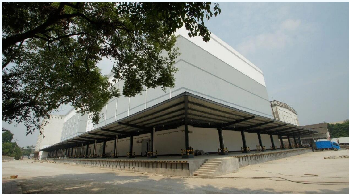
公司成立后新建厂区

重庆万吨公司坐拥得天独厚的区位优势，210国道穿门前而过，1.7公里长的两条铁路专线直达冷库站台并与成渝铁路相连。据悉，重庆万吨公司占地面积20万平方米，建筑面积28万平方米，总容量达12万吨的冷藏库群整齐矗立，2万平方米的冻品交易市场，构成了集仓储、交易、物流于一体的现代化冷链产业布局。