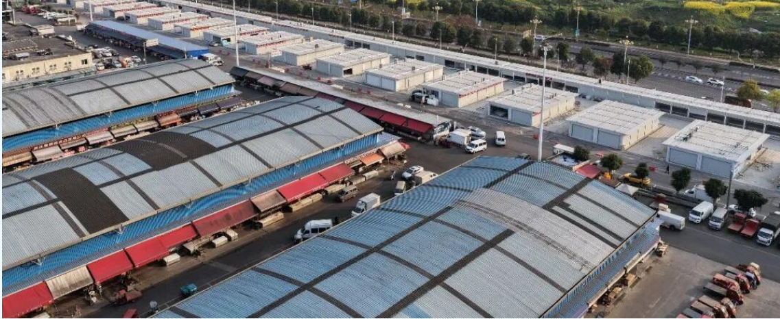
双福国际农贸城牛羊禽肉交易区

2026年3月14日，重庆双福国际农贸城牛羊禽肉交易区正式投用运营，市场划行规市完成肉类业态优化升级，肉类交易规模化、规范化水平进一步提升。