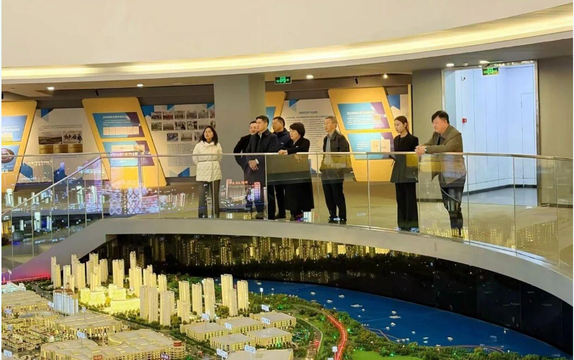
湖北省汉口北市场群

发展试点的文三数字生活街区，彻底跳出传统电子产品交易市场的定位，成功转型为集产品展示、科普教育、旅游体验于一体的多功能场所。当地菜市场在业态布局、品牌培育、民生服务及打造“邻里生活空间”等方面的做法，为推动我市菜市场提质增效提供了有益参考。